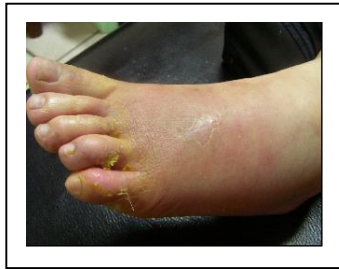
(香港腳引起的蜂窩性組織炎)。

蜂窩性組織炎，坊間名為<紅腳紅>，意謂其發病的第3~5天，患部的組織會比先前的患部更紅、更腫，此時也就是疾病急性巔峰期。