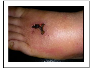
(傷口引起的蜂窩性組織炎)。