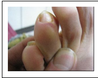
(灰指甲引起的蜂窩性組織炎)。