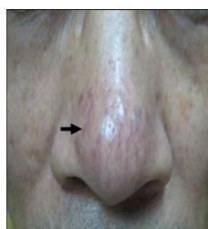
毛囊口擴大,毛細血管擴張,縱橫交錯