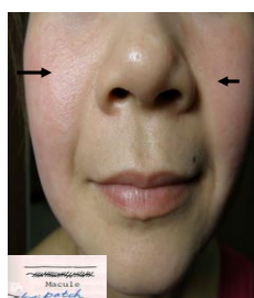
類固醇外用藥停後,病人皮膚潮紅、灼熱感。臉頰像紅斑性狼瘡的蝴蝶斑