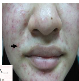
病人臉頰紅疹、膿疱