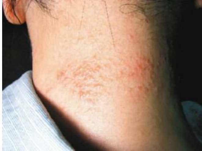
異位性皮膚炎徵兆：丘疹、小水泡

門診中，常可看到焦慮的媽媽帶著緊張不安的小孩來求診。小孩一面哭、一面抓身體，當媽媽拚命哄時，小孩卻愈哭愈厲害。異位性皮膚炎是一種具有明顯哮喘、過敏性鼻炎和濕疹家族性傾向的皮膚病，精神、季節變化也是影響本病的重要因素。