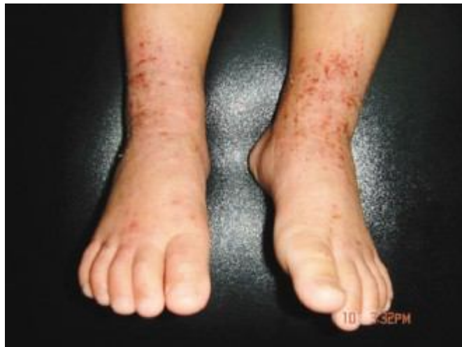
足踝部成群癢性丘疹併有滲出物

1.濕熱內蘊：多見於嬰兒期，皮疹以紅斑、水泡、糜爛、滲出物、結痂為主，伴有劇癢、煩躁、納差。以清熱利濕法，如脂漏性皮膚炎表風熱兼濕，中醫稱「面游風」，方選脂漏方或大青龍湯，麻杏薏甘湯加上黃芩、黃連、黃柏、荊芥、防風、皂角刺、刺蒺藜、生石膏、潞潞通等。